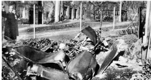
BOMBES SUR MEZIERES